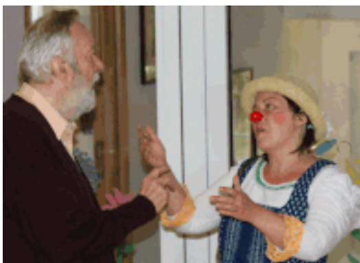
Pipa in Aktion

ravensburger clowns e.v. Geschäftsstelle Sunthaimstraße 7 • 88213 Ravensburg Tel 0751 35504805